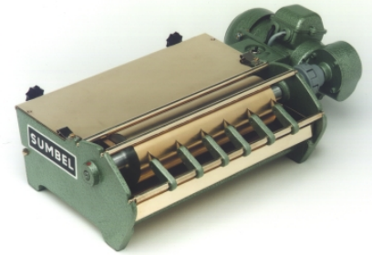
Modell ENANO 250 mm

Optionen : Edelstahl Ausführung, regelbare Geschwindigkeit, Kartonaufsatz für Postkartenkarton, Streifenbelegung etc.