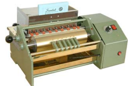
Modell CORONA 250 mm