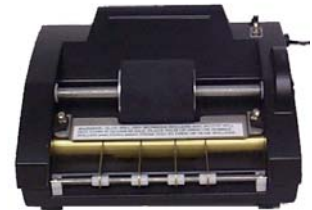
Modell LABEL PRO 5.5